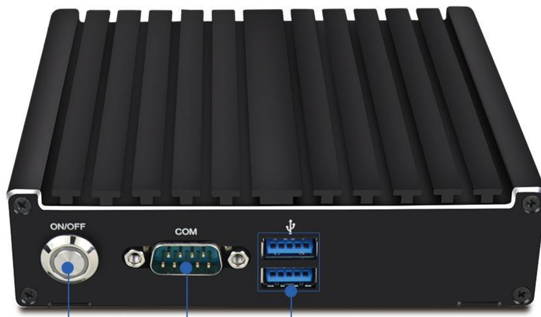
电源开关 COM 2*USB3.0