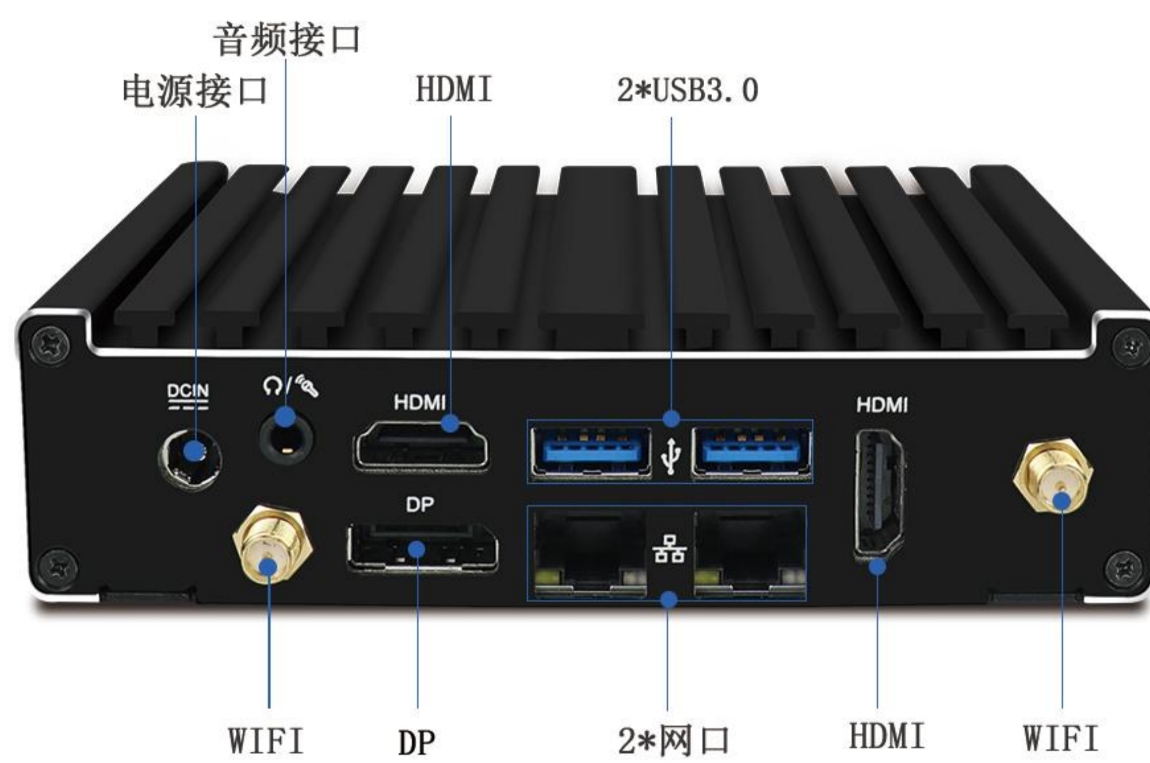
音频接口 电源接口 HDMI 2*USB3.0 WIFI DP 2*网口 HDMI WIFI